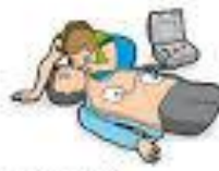
5 - Poursuivre au moins 2 minutes