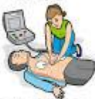
4 - Poursuivre le massage jusqu'à l'arrivée des secours