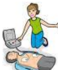
3 - Appliquer le DAE rapidement, dès que possible