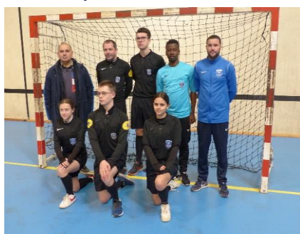
Site de Laval : Finale U13