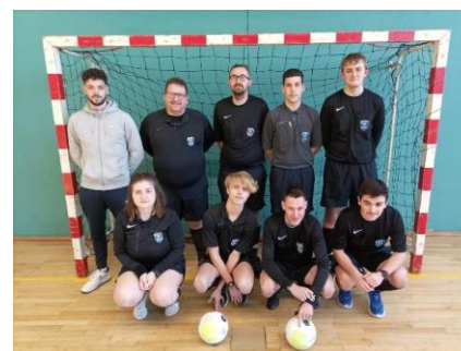
Site de Craon : Finale U15, U18