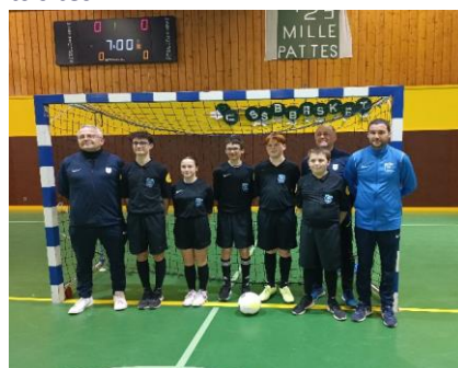
Site de St Berthevin : Finale U11