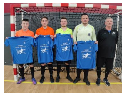
Site de Lassay : Finale Féminines

Merci à eux pour l'investissement et l'implication durant les rencontres, ainsi aux divers responsables arbitres sur les différents sites.