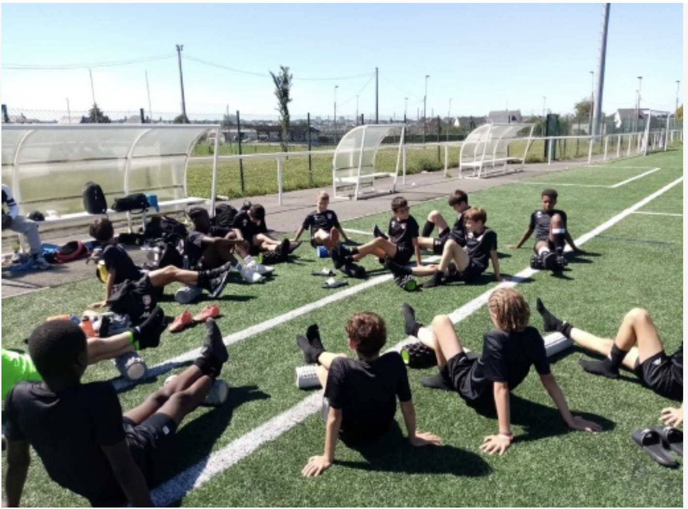
PLANCHE Récupération (j+1 match)