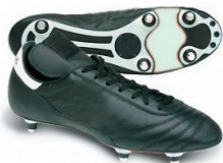
Crampons « vissés » Terrain gras ou humide