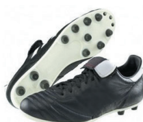
Crampons « moulés » Terrain sec ou dur

Pour entretenir ses chaussures de foot et les faire durer plus longtemps :