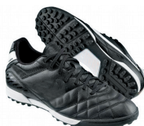
Crampons « stabilisés » Terrain synthétique